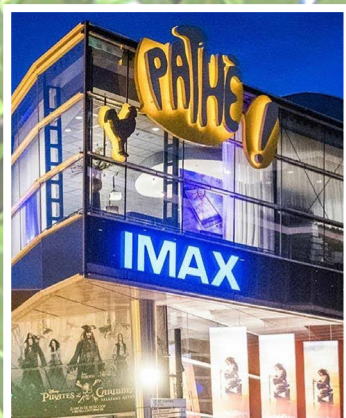
DOE EENS EEN BIOSCOOPJE pagina 4