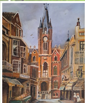
SCHILDERIJ pagina 5