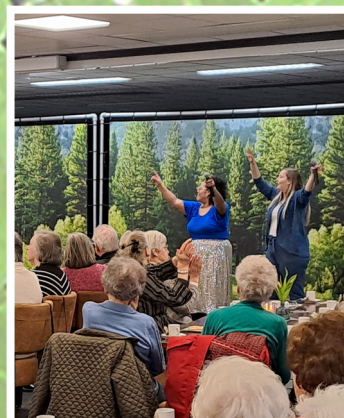
ABBA TRIBUTE pagina 7