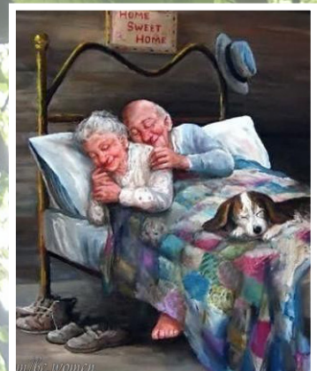
GELUK pagina 7