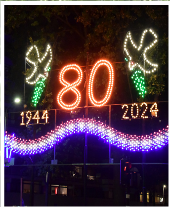
LICHTJESROUTE pagina 4